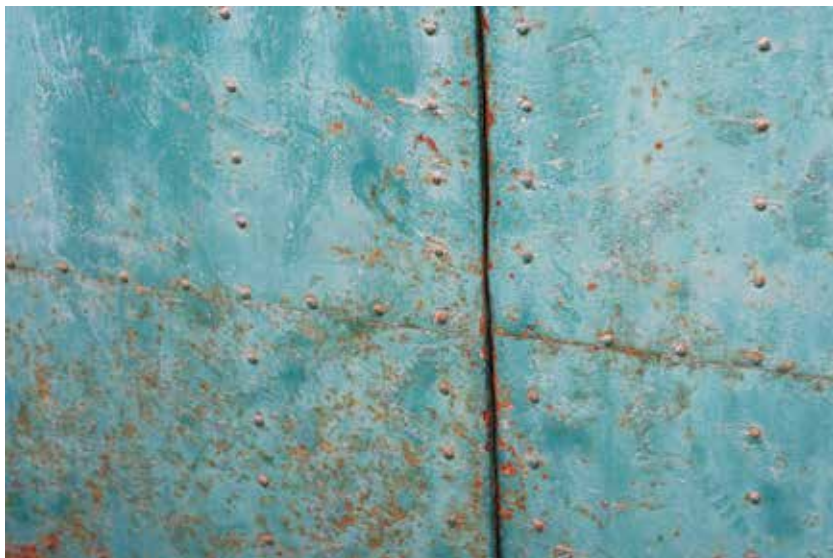
Urška Nina Cigler: Modre pike, barvna fotografija, 25 × 38 cm, 2010