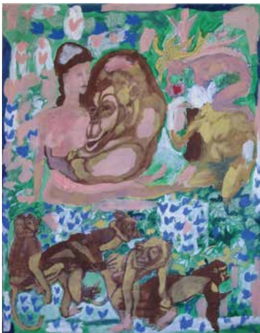
Taja Ivančič: Regresa, akril na platno, 90 × 70 cm, 2015