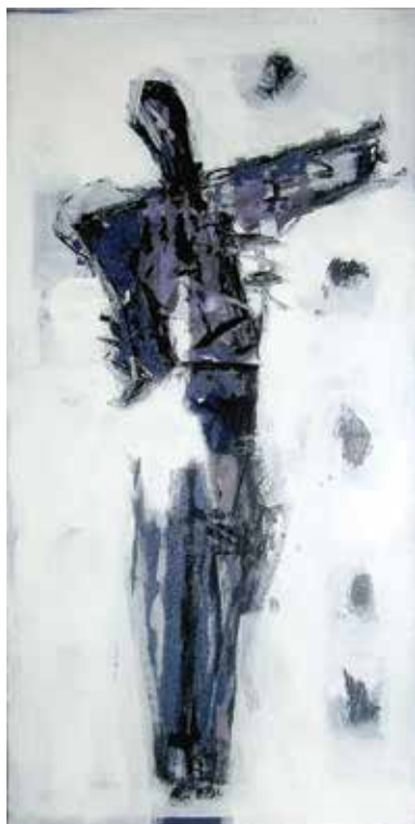
Črtomir Freljih: S križa, akril na platno, 120 × 60 cm, 2002/2003