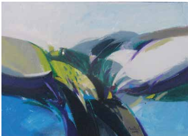
Lucijan Bratuš: SV (Sinji vrh) 3, akril na platno 50 × 70 cm, 2014