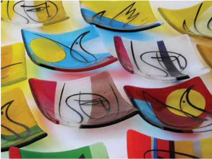
Matej Metlikovič: Ptice in angeli, krožniki iz cikla Prgišče svetlobe, taljeno barvno steklo s črtno poslikavo, izvedba v steklu: Stojan Višnar, 15 × 15 × 4 cm, 2014/2015