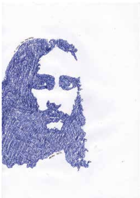
Arjan Pregl: Risba iz serije 299 kosmatih, kemični svinčnik, 29 × 21 cm, 2010