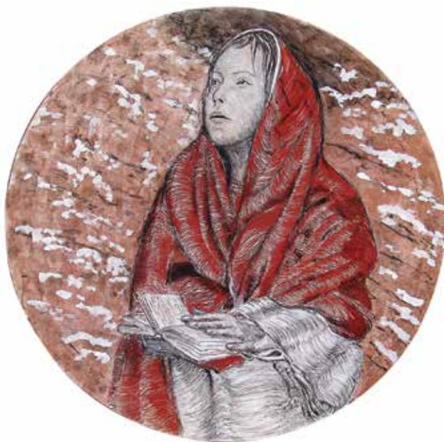
Catherina Zavodnik: Kaliopa, muza epske poezije (avtoportret), mešana tehnika, 96.5 cm, 2014