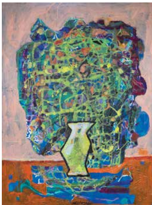
Marta Jakopič Kunaver: Šopek zate, akril na platnu, 60 × 80 cm, 2015