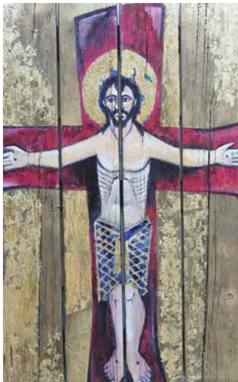
Jože Bartolj: Morski korpus, mešana tehnika, 100 × 70 cm, 2006