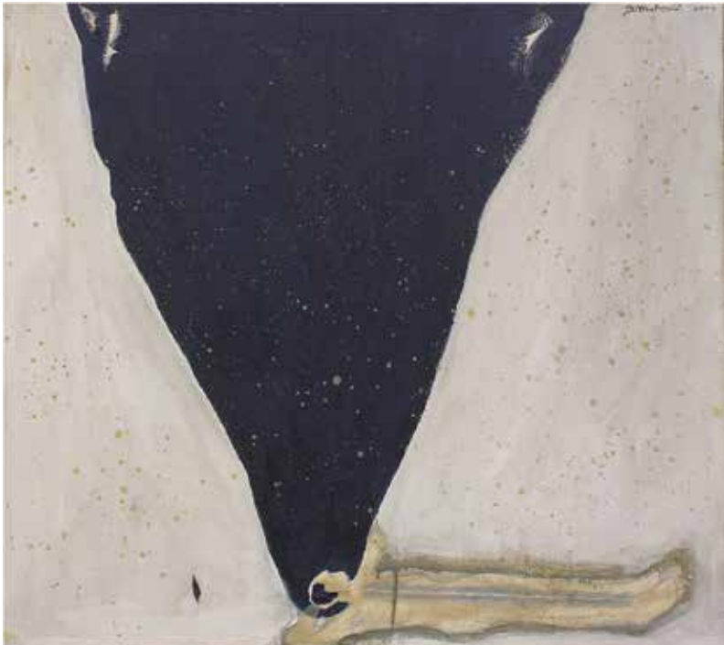
Jožef Muhovič: Prepadi navzgor, olje na platnu, 120 × 120 cm, 2004