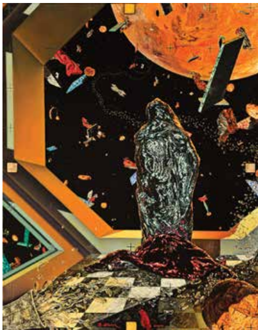
Darko Slavec: iz cikla Angeli kozmosa I., olje na platno, 65 × 55 cm 2000 – 2002